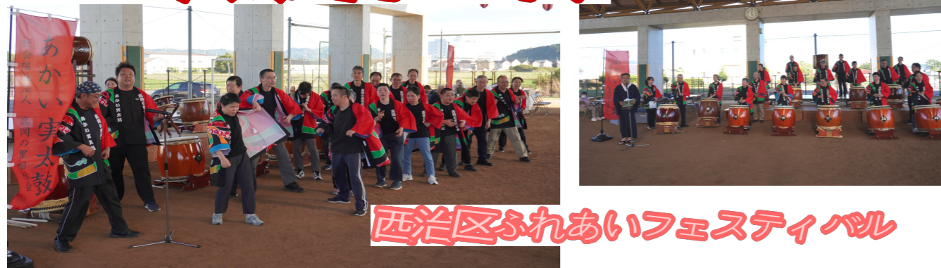
西治区ふれあいフェスティバル

高岡の里福祉会の「あかい実太鼓」について、より本格的に法人の太鼓チームとして活動できる様、体制を一新！4月より、もちの木園だけではなく、たかはしサポートセンターの職員も活動に加わる事となりました。そんな中、活動に参加する利用者様も4名増え総勢15名に。そして、新体制となるにあたって法被を新調。その法被を、8/11 サルビアドームにて西治区ふれあいフェスティバルに出演させていただいた際、初お披露目。8/27 もちの木園で行われた福崎高校ギターマンドリン部との交流会でも、その新しい法被を身にまとい、張り切って演奏しました。コロナ禍でなかなか出来なかった地元の行事への参加や、近隣学校との交流会が再開できるようになって嬉しい限りです。指導頂く民謡集団「鯨」様と共に、これからも色々な場所で出演し、見て下さる方々に笑顔と元気をお届け出来る様、チーム一丸で頑張っていきたいと思っております。（名田）