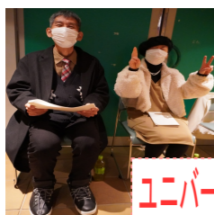
ユニバーサルな文化祭

令和5年5月8日、新型コロナウイルスの感染症の位置づけが2類から5類へと変更になりました。写真にあるように、喫茶店利用や地域のイベントといった外出機会や、福崎西中学校等との交流会等を再開できるようになった事は、令和5年度のとても大きな出来事でした。町や地区の行事に誘っていただいた事も、本当に嬉しく思いました。とはいっても、久々の外出で手探り状態で再開しており、提供できた機会は少なかったというのが実情です。ふれあい祭も、施設内のみでの行事という状態が続いています。一度に元には戻せませんが、今年度は、外出や地域との交流機会を増やし、少しでも利用者様が張り合いをもって楽しく生活できる様、工夫していきたいと思ひます。(名田)