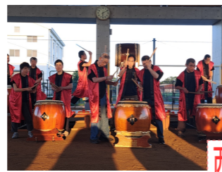
西治区フェスティバル