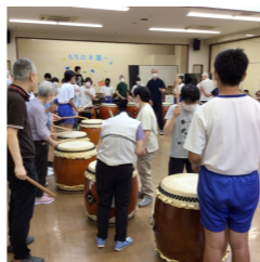
西中学校との交流会