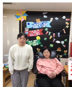
季節のレクリエーション