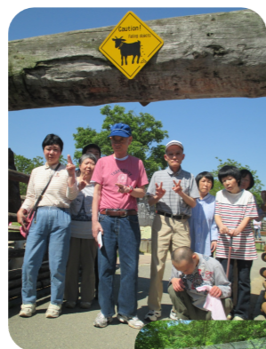
セントラルパーク